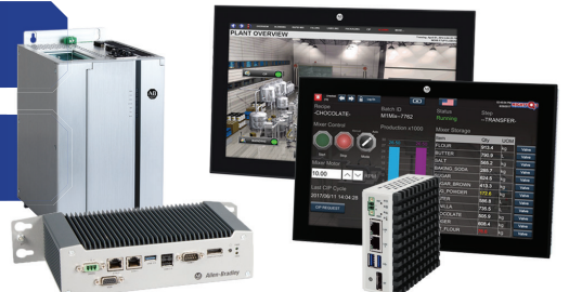
シンクライアント端末やモニタ類も豊富にラインナップ